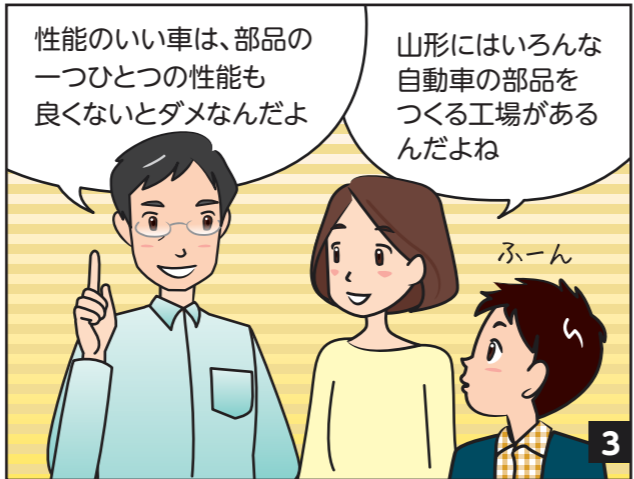
山形で作られている自動車部品の例